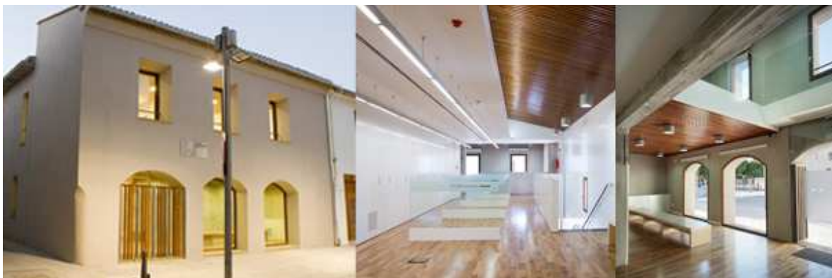
CENTRO SERVEF DE EMPLEO ALAQUAS. PROYECTO Y DIRECCIÓN DE OBRA 2006-2007.

Cálculo de eficiencia energética: sistemas activos y pasivos (LIDER, CALENER, CERMA), Obtención de la calificación energética según RD 47/2007, Obtención de certificados de calidad para inmuebles (Perfil de Calidad IVE), etc.