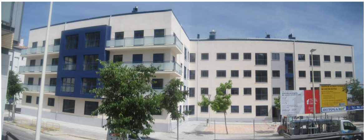
PROYECTO Y DIRECCIÓN DE OBRA. EDIFICIO DE 48 VPO EN XÁTIVA (VALENCIA) 2007-2010

Yestudio tiene como vocación el aportar las mejores soluciones posibles a los problemas y necesidades de los clientes.