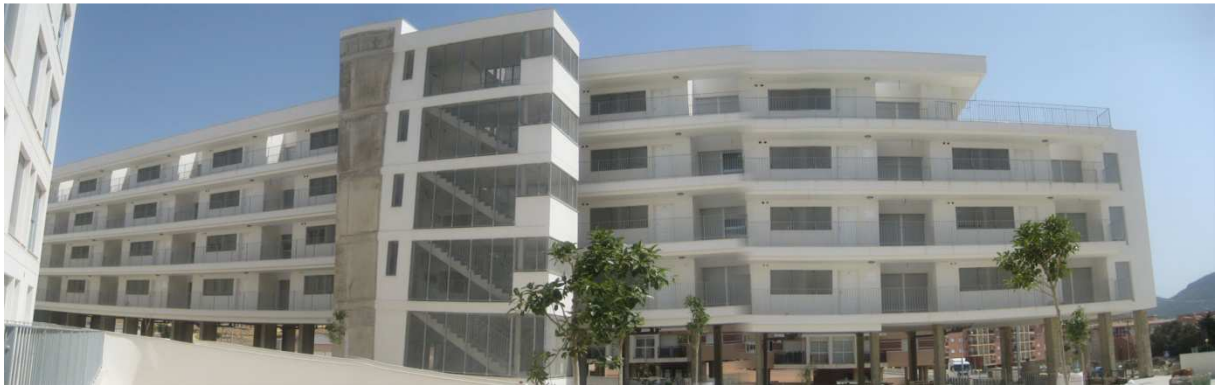
81 VPO EN CARTAGENA (MURCIA)-DIRECCION DE OBRA 2008-2009