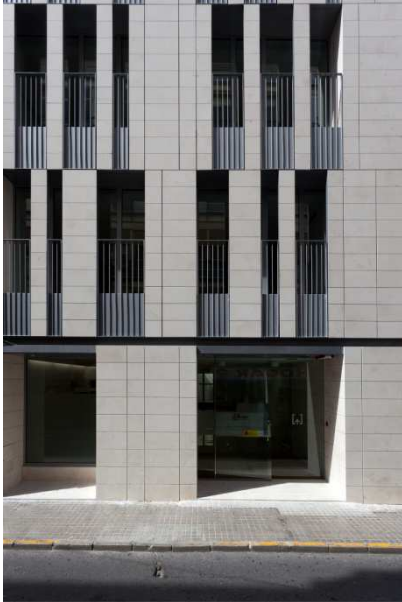
CENTRO SERVEF DE EMPLEO ELDA (ALICANTE). PROYECTO Y DIRECCIÓN DE OBRA 2009-2013