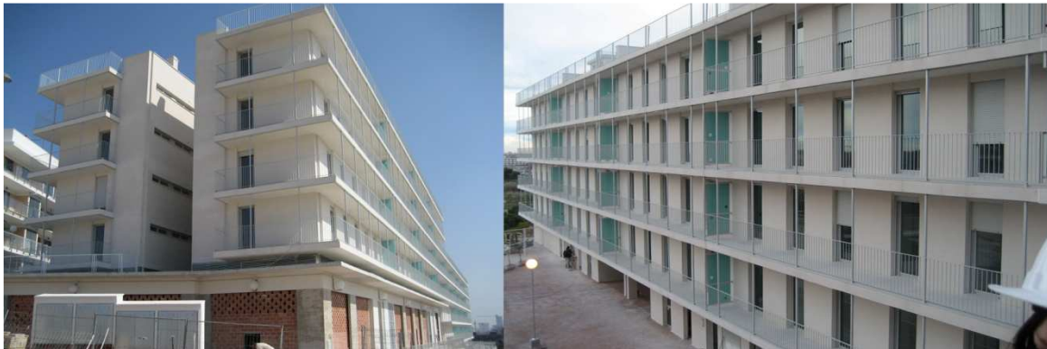
DIRECCIÓN DE OBRA. EDIFICIO DE 72 VPO EN MAS DEL ROSARI (PATERNA, VALENCIA) 2007-2009