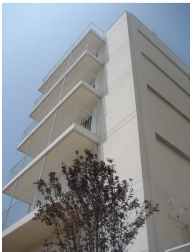
EDIFICIO DE 72 VPO EN MAS DEL ROSARI (PATERNA, VALENCIA) 2007-2009

Banco de Valencia VIP PROMOCIONES INMOBILIARIAS SUR, S.L.U y VIP GESTIÓN DE INMUEBLES, S.L.U Compañía Levantina de Edificación y Obras Públicas, S.A. (CLEOP, S.A.) Binaria Compañía General de Construcciones, S.L. Inmocreop, S.A Agrupación de Interés Urbanístico "Camino Hondo del Grao". Mas del Rosari Promotora de viviendas protegidas, S.L. SERVICLEOP, S.L. In Hoc Signo Vincas. S.L. F.S.G.G. ( Fundación Secretariado General Gitano ) GEROCLEOP, S.L. PROYCO ingenieros, S.L. Ródenas Jara Proyectos y Obras S.L.L. Hairiss Viviendas, s.l. Saroni 2000, S.L. MIARCO, S.L. VALEKTRA XXI, S.L., Inmotasa Rodríguez y Martí, C.B. COYCOVAL, S.L.,