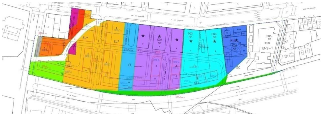
PROYECTO DE REPARCELACIÓN "CAMINO HONDO DEL GRAO". VALENCIA. 2008

Redacción de Informes de sostenibilidad económica en el planeamiento