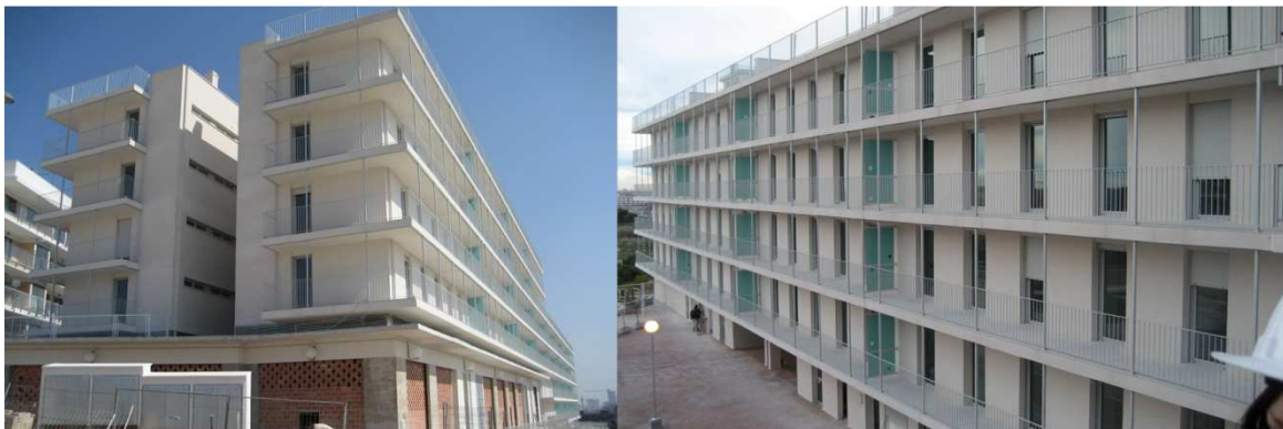
DIRECCIÓN DE OBRA. EDIFICIO DE 72 VPO EN MAS DEL ROSARI (PATERNA, VALENCIA) 2007-2009