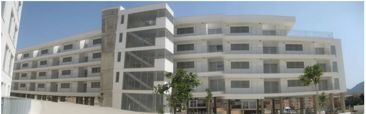
81 VPO EN CARTAGENA (MURCIA)-DIRECCION DE OBRA 2008-2009